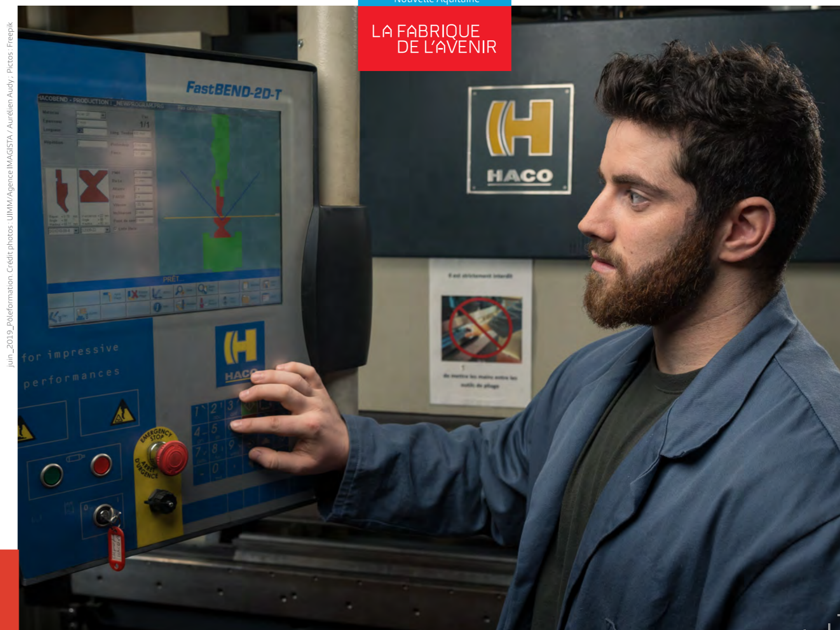
juin_2019_pôleformation - Crédit photos : UIMM/Agence MAGISTA / Aurélien Audy, Pictos : Freepik